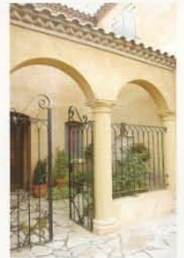
Proyecto y Dirección - Figueroa Bunge • Rocha Año de Realización 2004 - superficie cubierta 295 m 2 - semicubierta 54 m 2

Más información en Compendio Profesional