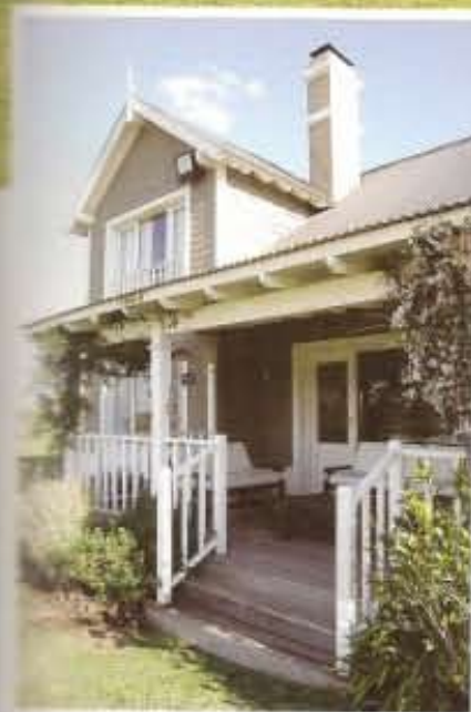
Proyecto y Dirección - Figueroa Bunge • Rocha Año de Realización 2003 - superficie cubierta 258 m 2 - semicubierta 85 m 2