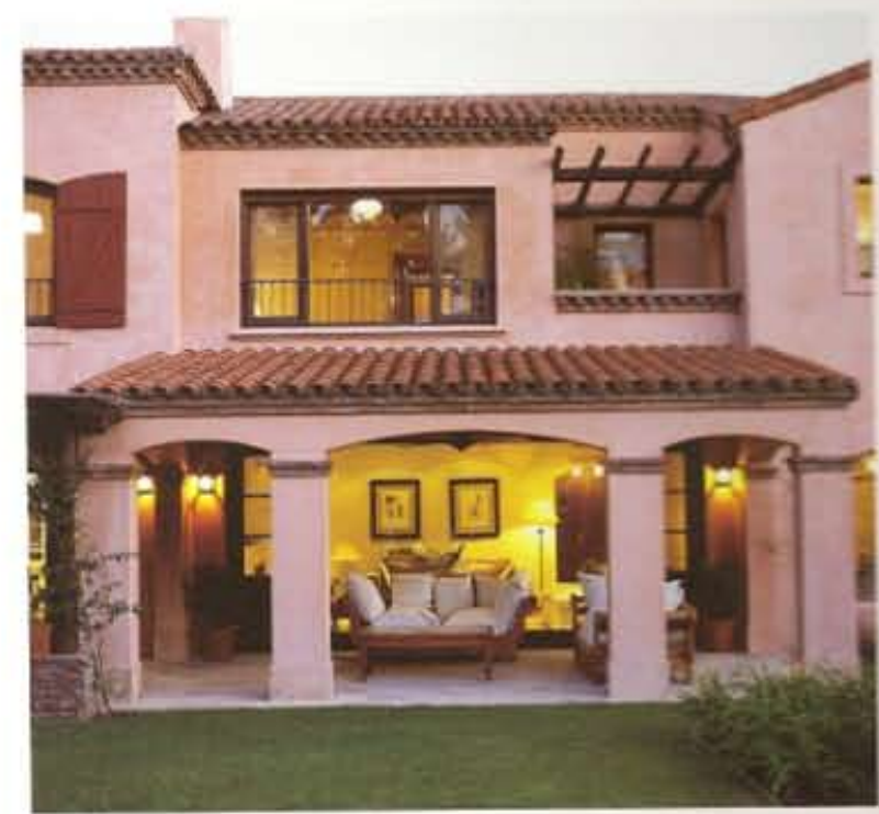
Proyecto y Dirección - Figueroa Bunge • Rocha Año de Realización 2005 superficie cubierta 285 m 2 - semicubierta 82 m 2

Más información en Compendio Profesional